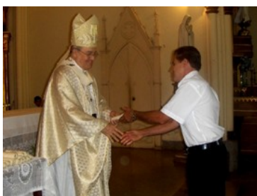
El Cardenal entrega el diploma a uno de los graduados del curso "El secreto de Pablo".

La celebración fue marco propicio para realizar la primera graduación del "Aula Saulo", un espacio de formación para todos los miembros de la parroquia. En esta oportunidad nuestro Cardenal entregó los diplomas a los 30 graduados del curso "El secreto de Pablo".