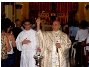
Momento de la celebración.

En su homilía el Sr. Cardenal, quien más tarde compartió con la comunidad al final de la Misa, nos habló del Amor de Dios, de la necesidad que tiene el mundo de experimentarlo y que fiel, a la enseñanza de Jesús, los cristianos debemos ser testigos de ese Amor y conciliadores en medio de una sociedad tan individualista como la actual.