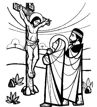
Tu cruz adoramos Señor, y tu santa resurrección glorificamos VIERNES SANTO