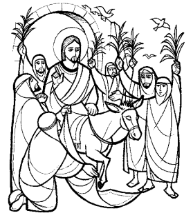
¡Bendito el que viene en el nombre del Señor!

Acompañemos con fe y devoción a nuestro Salvador en su entrada triunfal a la ciudad Santa de Jerusalén, para que participando ahora de su cruz, podamos participar un día de su gloriosa resurrección y de su vida. Amén.