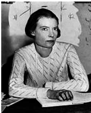
Dorothy Day, oblata benedictina, fundadora del Movimiento de Trabajadores Cristianos, en 1933.

Fundadora del Movimiento de los Focolares, en 1943, cuyo nombre oficial es Obra de María.