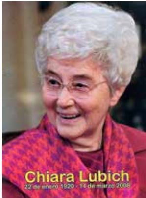
Chiara Lubich 22 de enero 1920 - 15 de marzo 2008

Fundadora del Movimiento de los Focolares, en 1943, cuyo nombre oficial es Obra de María.