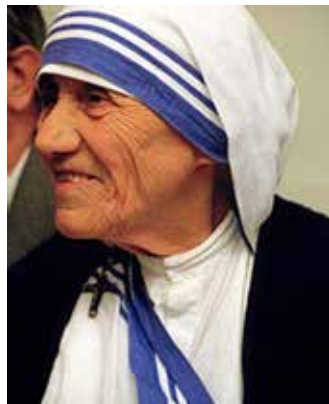
Santa Teresa de Calcuta, fundadora de la congregación de las Misioneras de la Caridad, en Calcuta, en 1950.